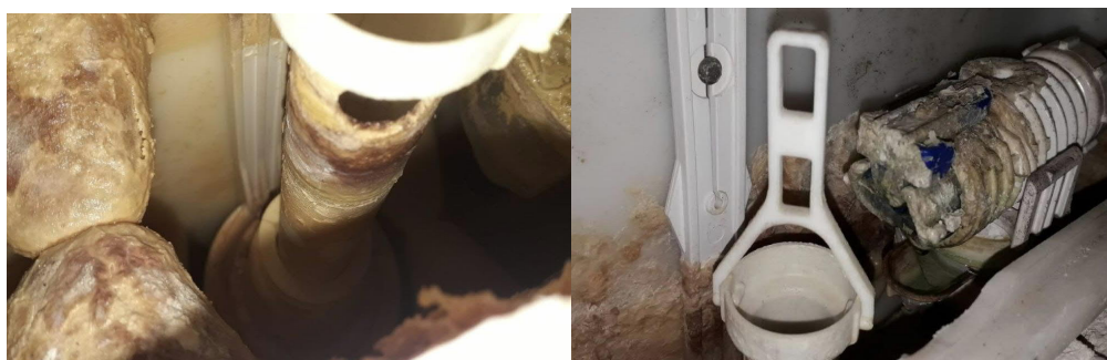
Abbildung 2: Schäden Sanitärinstallationen und Leitungen

In Bereichen des Flachdachs trat Wasser ein und die Sanitäreinrichtungen, insbesondere das Leitungsnetz im älteren Gebäudeteil, erwiesen sich teilweise als stark sanierungsbedürftig.