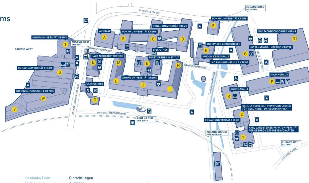
Lageplan Campus Kreams