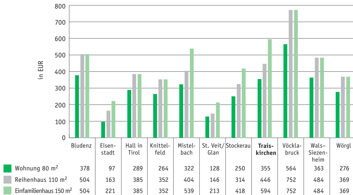
Abbildung 1: Vergleich der jährlichen Kanalbenutzungsgebühren/–entgelte ohne Regenwassereinleitung (Stand 2011)